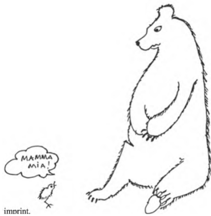
9) Zeichnung von Isabella Rossellini „when chicks imprint“ (Seite 81)