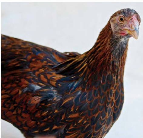
4) Red Caps -Henne, die trotz roter Ohrläppchen weiße Eier legt (Seite 89)