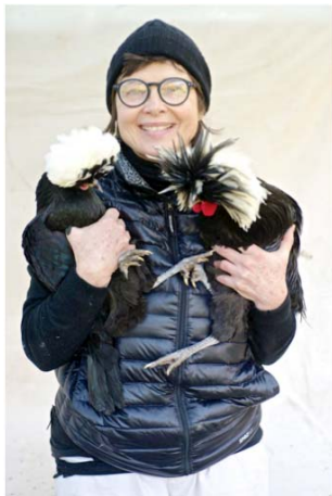
1) Isabella Rossellini mit Polish -Hühnern im Arm (Frontispiz)

Text und Zeichnungen von Isabella Rossellini Mit Photographien von Patrice Casanova 120 Seiten, 67 Photographien, 70 Zeichnungen ISBN 978-3-8296-0793-3 € 24.80, (A) € 25.50, CHF 28.50