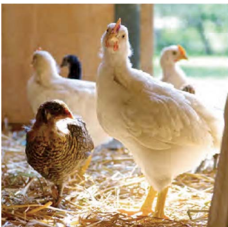
11) Zwei 4 Wochen alte Hühner: Links eine ursprünglich Rasse, rechts ein Broiler (Seite 69)