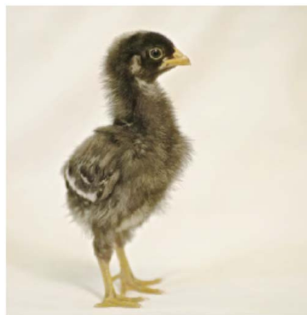
5) Eines der Küken, die Isabella per Online-Bestellung bekommen hat (Seite 9)