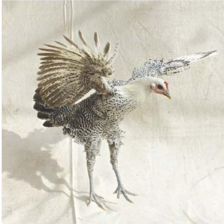
7) Fayoumi -Huhn aus Ägypten (Seite 87)