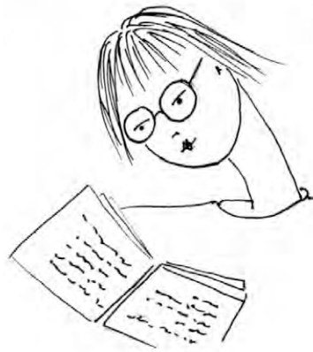
2) Selbstportrait, Zeichnung von Isabella Rossellini (Seite 36)