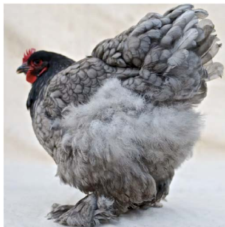
12) Cochin -Huhn, ursprünglich aus China (Seite 102)