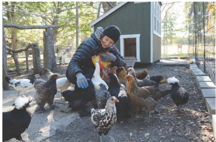
10) Isabella Rossellini auf ihrer Farm, Long Island/New York (Seite 82/83)