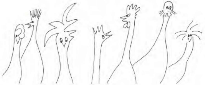
8) „Diversity is important“, Zeichnung von Isabella Rossellini zur Artenvielfalt von Hühnern (Seite 85)