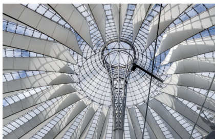
Sony Center, Berlin, 2000

Das großformatige Buch Helmut Jahn Buildings 1975-2015 Photographs Rainer Viertlböck , ein Gemeinschaftsprojekt zweier Künstler, die die leidenschaftliche und erfolgreiche Hingabe an ihre jeweilige Profession verbindet, präsentiert die bahnbrechenden Architekturen Jahns in 184 ganzseitigen Tafelabbildungen. Die Schwarz/Weiß- und Farbphotographien Viertlböcks stellen die spektakulären Monumentalbauten und deren unverwechselbare Glas-Stahl-Architektur im Dialog mit ihrer direkten Umgebung vor – in doppelseitigen Panorama-Bildern wie auch in fast abstrakten Detailaufnahmen. Von Chicago und Las Vegas bis Singapur und Shanghai, von München, Frankfurt und Berlin bis Tokyo sind die von Jahn seit den 1970ern entworfenen Hochhäuser, Bahnhöfe oder Flughäfen aus dem Stadtbild der Metropolen dieser Welt nicht mehr wegzudenken.