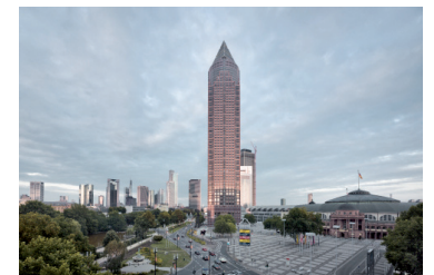
Messeturm und Messehalle, Frankfurt a.M., 1991