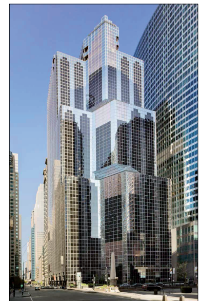
One South Wacker, Chicago, 1981