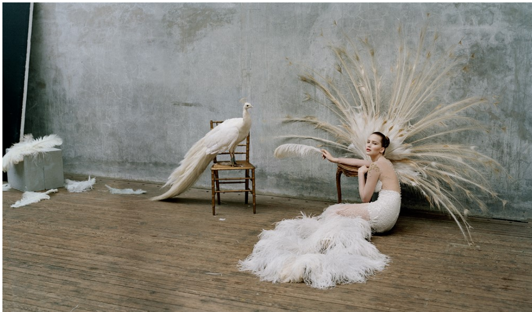
5) Jennifer Lawrence mit weißem Pfau. Copped Hall, Epping 2012