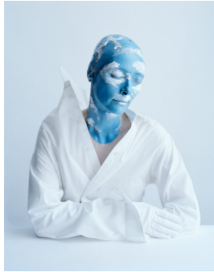
3) Tilda Swinton als Hommage an René Magrittes ‚L’Avenir des Statues‘. The Menil Collection, Houston, Texas, 2014