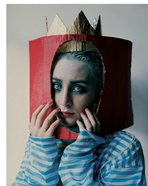
8) Saoirse Ronan mit Pappkrone- und ausschnitt. Fashion: Miu Miu. London, 2015