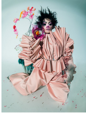
2) Björk. Fashion: Marlou Breuls. Reykjavik, 2017