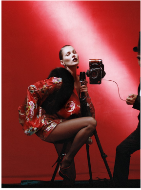
1) Kate Moss und John Galliano, Selbstportraits. Fashion: John Galliano. London, 2013