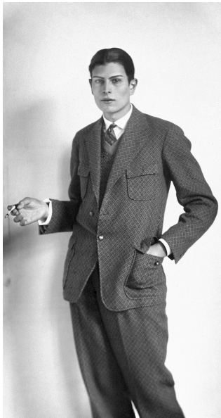
2) Gymnasiast, 1926