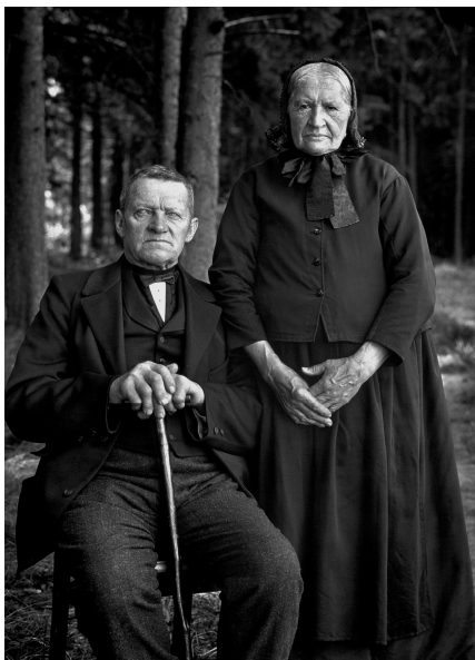
4) Bauernpaar aus dem Westerwald, 1912