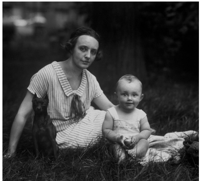
3) Junge Mutter, bürgerlich