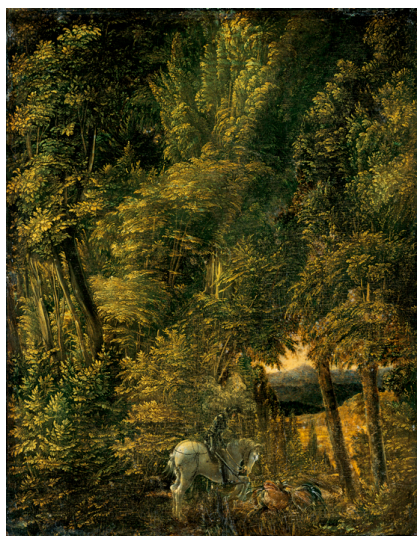
5) Albrecht Altdorfer, Der Drachenkampf des Hl. Georg, 1498