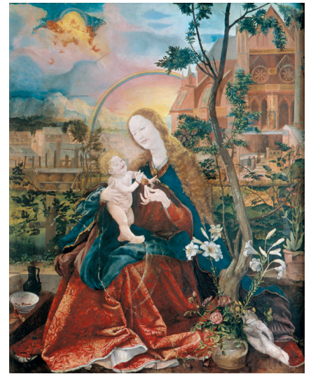
3) Matthias Grünewald, Die Stuppacher Madonna, 1519