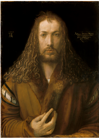
1) Albrecht Dürer, Selbstportrait, 1500