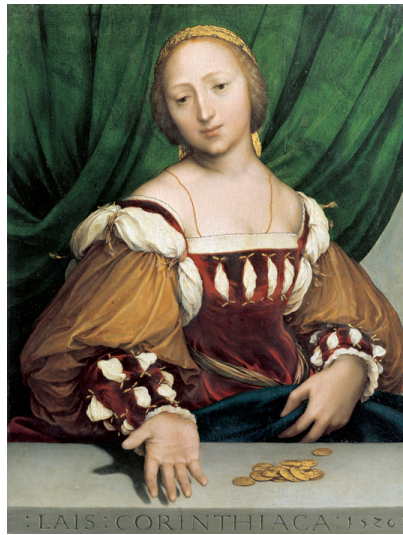
2) Hans Holbein, Lais Corinthiaca, 1526