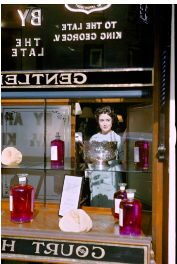
10) London, 1953