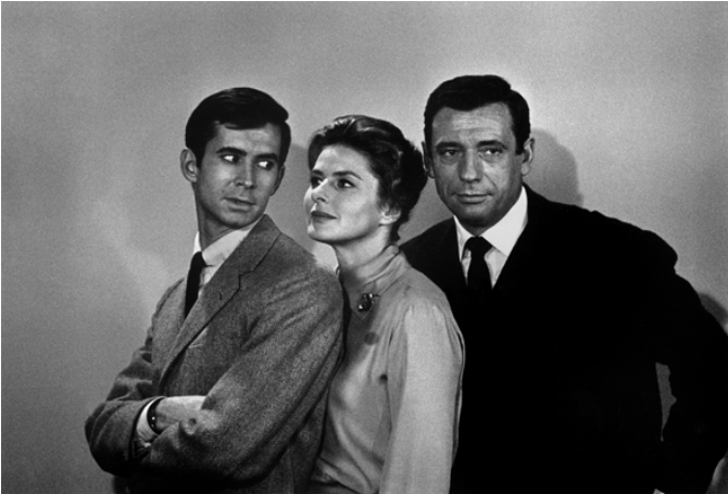
6) Anthony Perkins, Ingrid Bergman und Yves Montand am Set von Goodbye Again . Paris, 1960