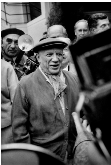
3) Pablo Picasso bei der Einweihung eines seiner Wandbilder im UNESCO-Gebäude. Paris, 1958