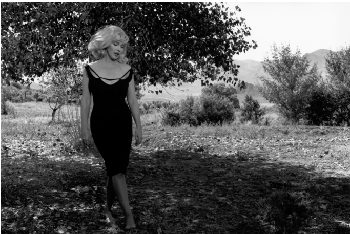
8) Marilyn Monroe am Set von The Misfits , Reno, NV, 1960