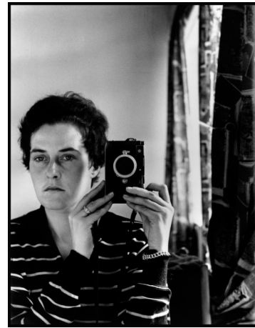
2) Inge Morath, Selbstportrait, 1960