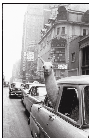
4) Ein Lama am Times Square. New York, 1957