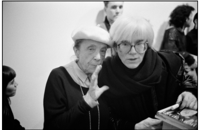
7) Louise Bourgeois and Andy Warhol. New York, 1987