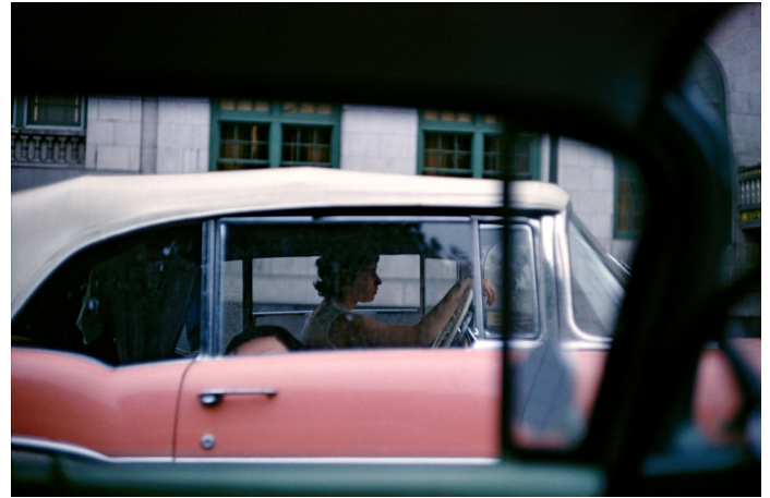
9) Reno, NV, 1960