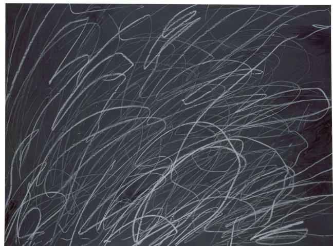
4) Cy Twombly: Obne Titel (Roma) . 1969 (Seite 148/149)