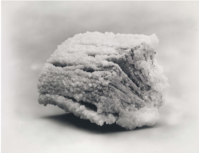
5) Tacita Dean: The Book End of Time. 2013 (Seite 92/93)