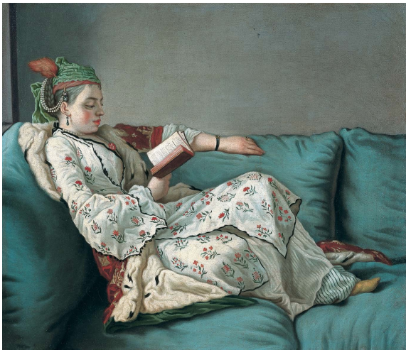
1) Jean-Etienne Liotard: Leserin im orientalischen Gewand . 1748-52 (Seite 4/5)