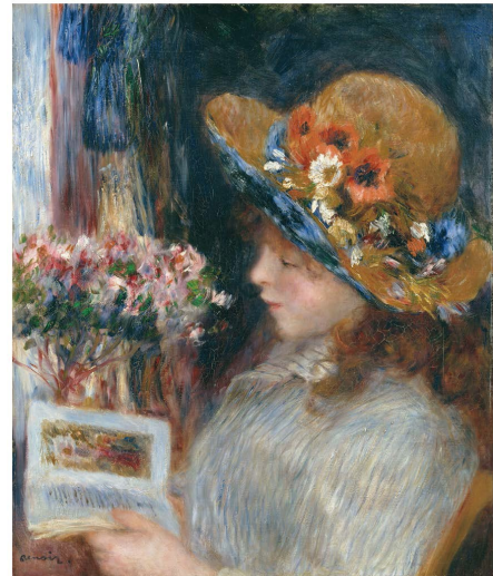
2) Auguste Renoir: Lesendes Mädchen . 1866 (Seite 98)