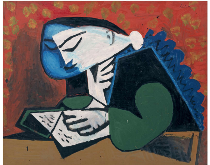
6) Pablo Picasso: Le Lecture. 1953 (Seite 112/113)