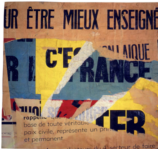
3) Jacques Villeglé: Rue de Faubourg Saint-Denis . 11. Mai 1965 (Seite 51)