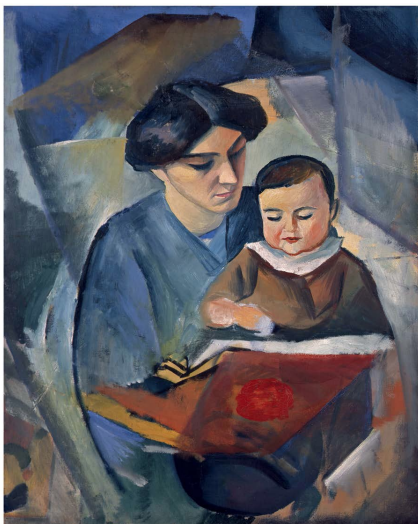
7) August Macke: Elisabeth und Walterchen. 1912 (Seite 130)