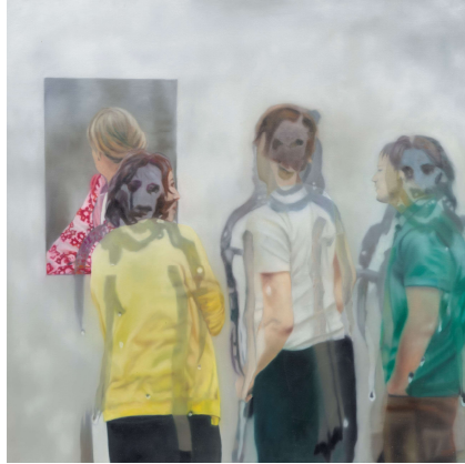
2) Ohne Titel, 2018 Öl auf Leinwand 80 x 80 cm