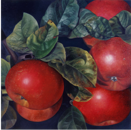
1) Ohne Titel, 1996 Öl auf Leinwand 200 x 200 cm