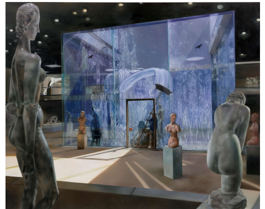
3) Ohne Titel, 2018 Öl auf Leinwand 180 x 220 cm