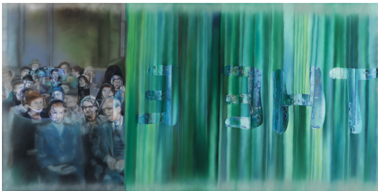
4) Ohne Titel, 2013, Öl auf Leinwand, 110 x 210 cm