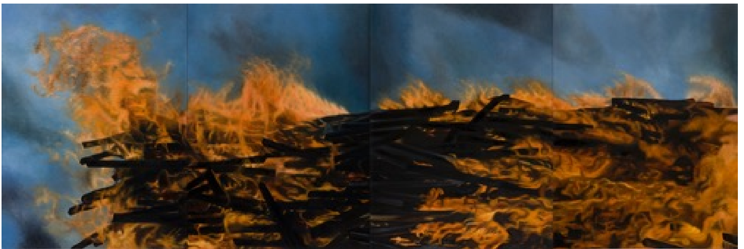
6) Ohne Titel, 1996, Öl auf Leinwand, 240 x 710 cm