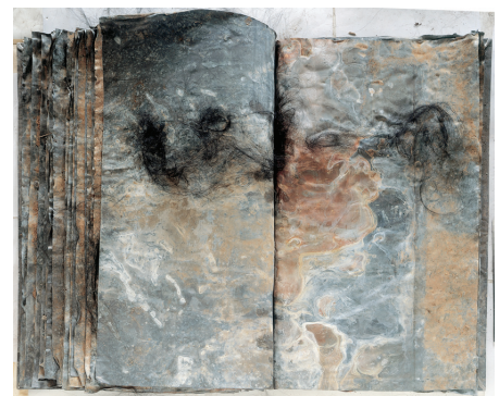
5) Sulamith , 1990