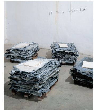
8) 20 Jahre Einsamkeit , 1991-2000