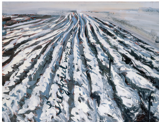
7) Siegfried vergißt Brünhilde , 1975