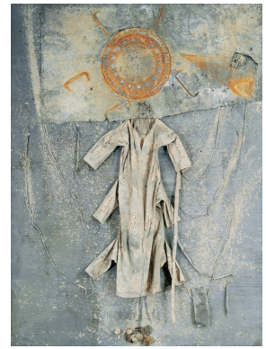
3) Die Sefiroth , 1990