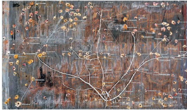
2) Every plant has his related star in sky , 2001