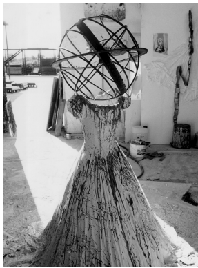
1) Die Frauen der Antike , Barjac, Gewächshaus, 2011

Daniel Arasse ANSELM KIEFER Die große Monographie 344 Seiten, 355 Farbabbildungen ISBN 978-3-8296-0703-2 € 39.80, € (A) 41.–, CHF 45.80