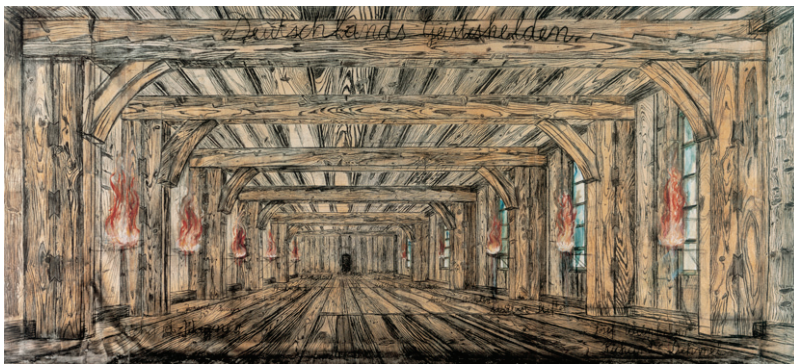
4) Deutschlands Geisteshelden , 1973