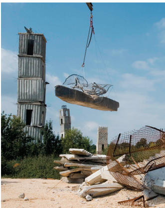
6) Barjac , 2006