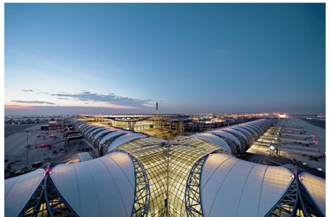
9) Suvarnabhumi Airport, Bangkok, 2006