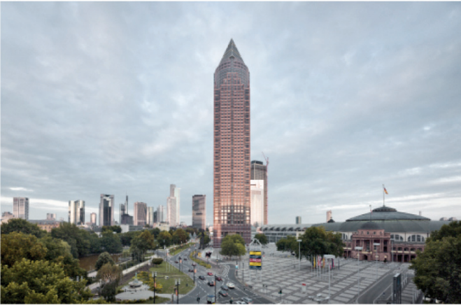
6) Messeturm und Messehalle, Frankfurt a.M., 1991