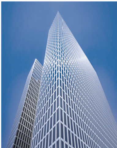
8) Highlight Towers, München, 2004