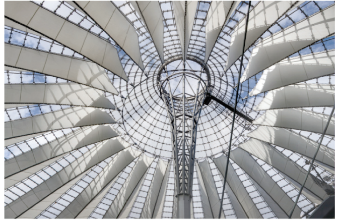
7) Sony Center, Berlin, 2000