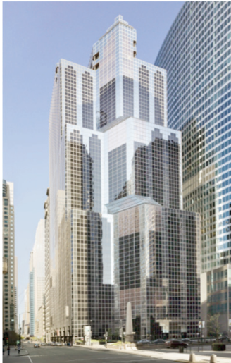
1) One South Wacker, Chicago, 1981