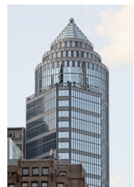
5) 750 Lexington Avenue, New York City, 1989