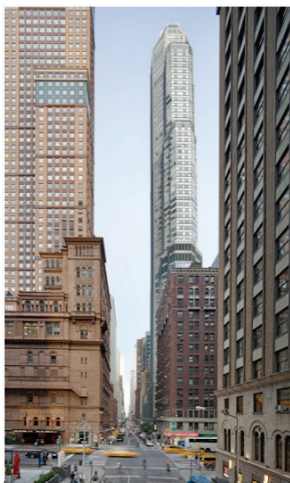
3) CitySpire, New York City, 1989