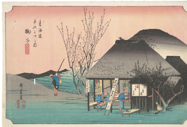
2) Utagawa Hiroshige, „Mariko“ aus der Serie „Die 53 Stationen des Tokaido, 1832-34