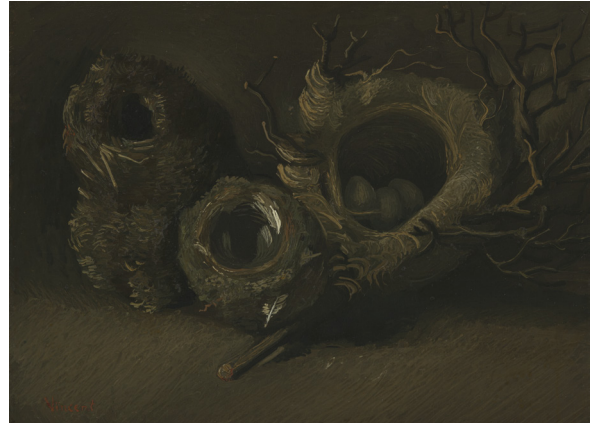
10) Vincent van Gogh, Vogelnester , 1885