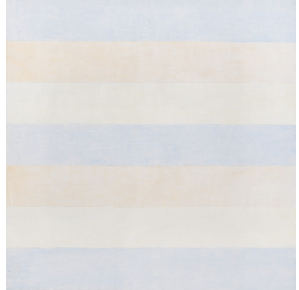
8) Agnes Martin, Untitled #5 , 1998