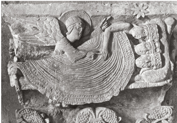
9) Gislebertus, Der Traum der Magier , um 1130/40