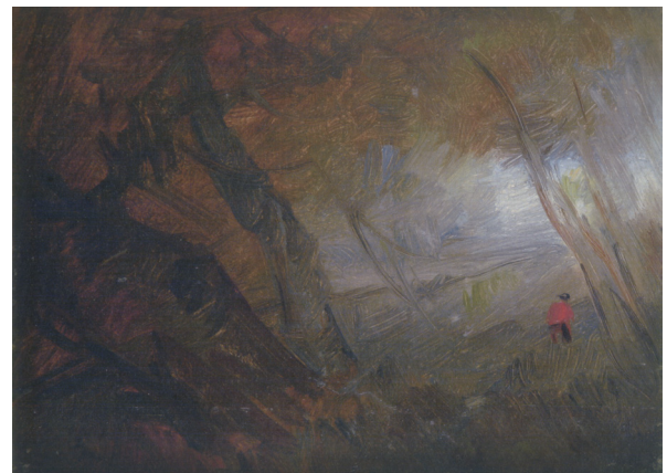
5) Wilhelm Busch, Neblige Herbstlandschaft mit Rotjacke , 1890er Jahre