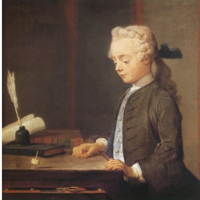
6) Jean Siméon Chardin, Portrait des Sohnes von Monsieur Godefroy , um 1738