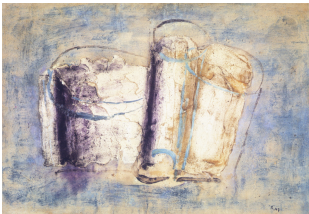
4) Jean Fautrier, Les boîtes de conserve , 1947