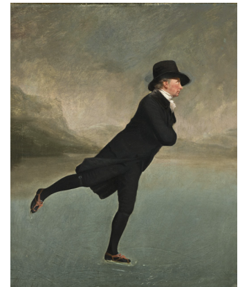
3) Sir Henry Raeburn (?), um 1790