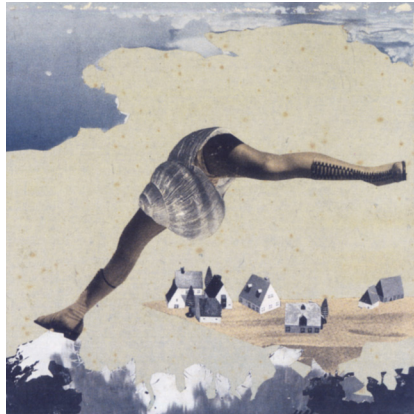
7) Hannah Höch, Siebenmeilenstiefel , 1933