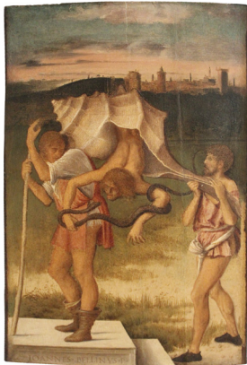
1) Giovanni Bellini, Allegoria (invidia-acedia) , um 1490

Patricia Görg Der Sturz aus dem Schneckenhaus Bilder und Rätsel 160 Seiten, 37 Farbabbildungen ISBN 978-3-8296-0987-6 Lp. € 39,80 €(Ö) 41,- CHF 45,80