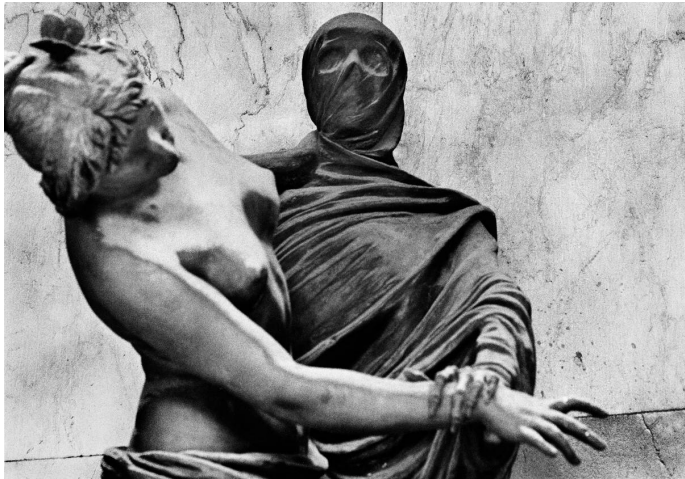
3) Cemeteries / untitled #16, Italien 1982. Aus: 33 Still Lives (Tafel 62)