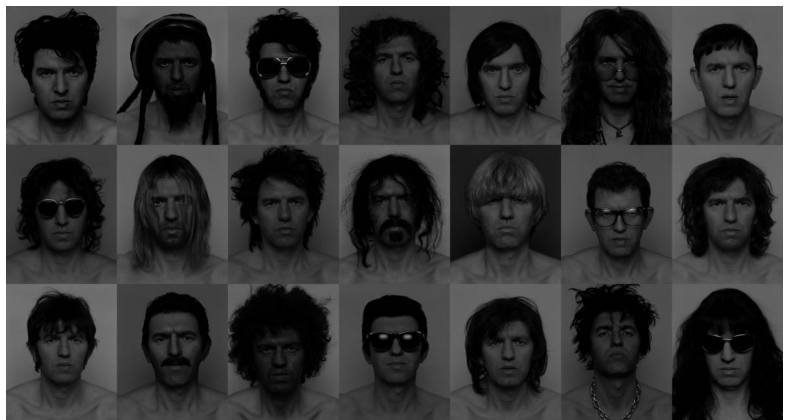
6) ,heaven, strijem, holland' 2002. Aus: a. somebody (Tafel 98)