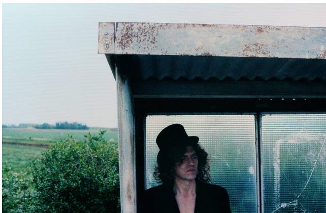
5) ,a. bolan 2, strijen, holland' 2002. Aus: a. somebody (Tafel 88)