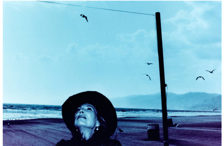
4) Joni Mitchell, Santa Monica 1999. Aus: 33 Still Lives (Tafel 71)