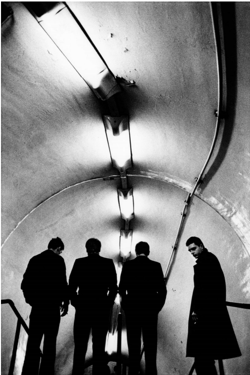
1) Joy Division, London 1979. Aus: Famous (Tafel 11)