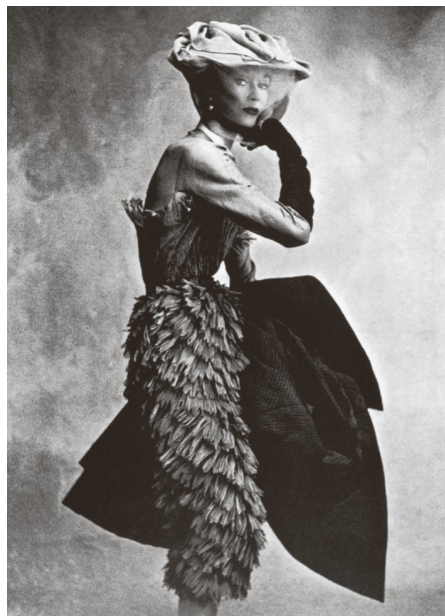
9) Irving Penns Photo aus dem Jahr 1950 inspirierte den jungen Karl Lagerfeld (S. 141)