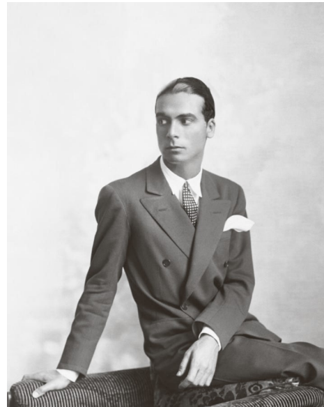
2) Balenciagas Pariser Portrait, 1927 (S. 29)