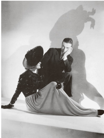
1) Balenciaga mit Modell (S.8)

Balenciaga, unser aller Meister Die Biographie von Mary Blume 264 Seiten, 74 Abbildungen, davon 9 in Farbe ISBN 978-3-8296-0795-7 € 22.80, (A) € 23.50, CHF 26.20