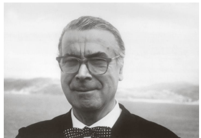
4) Balenciaga, 1962 (S. 227)