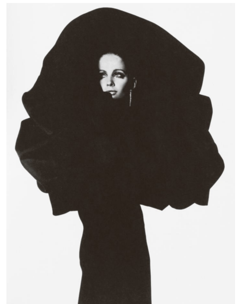
10) Das ausgefallene „Kohl“-Kleid von 1967 (S. 197)