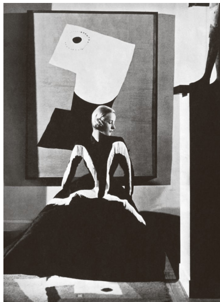
8) Winter 1939, fotografiert von George Hoyningen-Huene (S. 55)