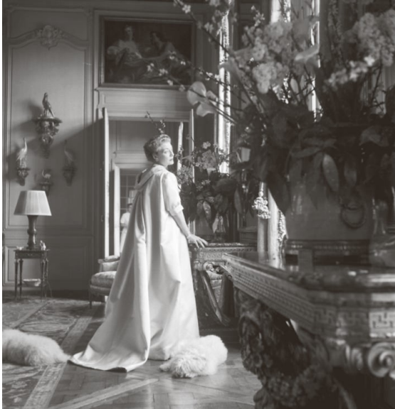
5) Mona Bismarck in ihrer Pariser Wohnung, wie Cecil Beaton sie sah (S. 128)